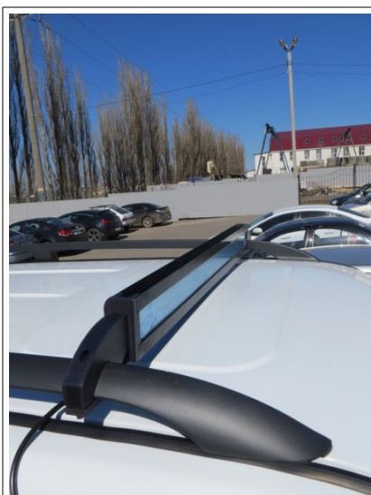
Полный Иллюминатор Мощность 0-100 Вт

Наиболее популярные среди автомобилистов, рыбаков, охотников, автотуристов модели светильников: