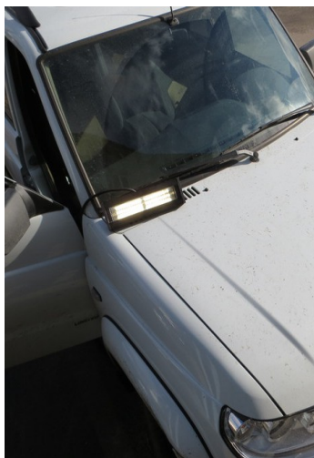
Малый Иллюминатор Мощность 0-25Вт